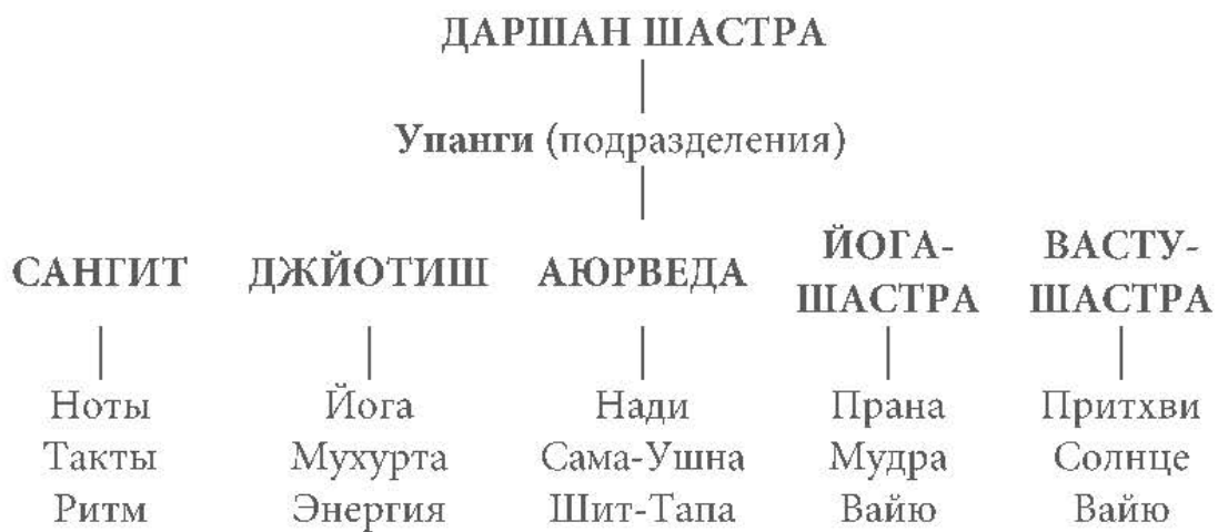
Таблица 4.1. Дисциплины, вышедшие из Даршаншастры

Данные элементы создают энергетические поля, необходимые для существования, эволюции и развития жизни. Подразделы Даршан-шастры подготавливают плодородную почву для того, чтобы семена Сат-Чит-Ананда расцвели и эволюционировали в долгий жизненный опыт.